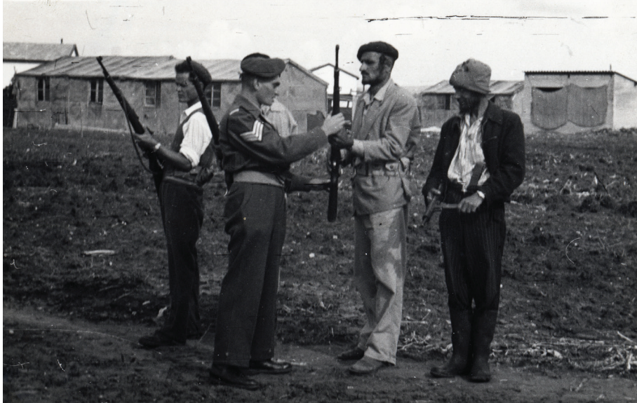
איור 2: שוטרי מג"ב מדריכים עולים חדשים בנשק (1954), תמונה מספר 0124.441, אלבום הנשיא יצחק בן צבי – סיורים, ארכיון התמונות על שם שושנה ואשר הלוי, באדיבות יד יצחק בן-צבי.

מג"ב גיבש ספרות הדרכה הכוללת הנחיות והמלצות לתושבים שיצאו למשימות שמירה. ביולי 1954 יצא לאור מדריך שמירה שכתב שמואל איתן (אחיו של רפאל איתן), ששימש קצין מג"ב באותן שנים, שכותרתו 'עקרונות השמירה האזורית'. במדריך הופיעו הנחיות המנוסחות ככללי עשה ואל תעשה, והם נועדו להבהיר לשומרים את המשמעת האישית ואת הדריכות המבצעית במהלך השמירה. המחבר ניסח עשרה עקרונות והגדיר אותם 'עשרת הדיברות'. דומה שהדמיון האטימולוגי למסמך מכונן מתורת ישראל נועד להקנות לו חשיבות אסוציאטיבית בקרב העולים החדשים, שרבים מהם היו שומרי מסורת יהודית. להלן עשרת העקרונות שגובשו במסמך: