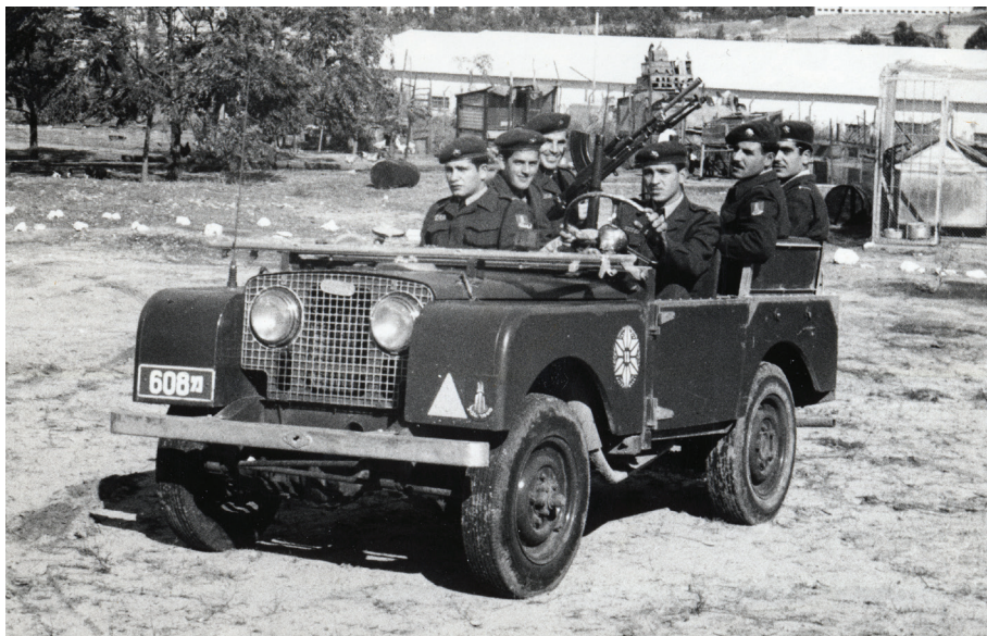
איור 1: שוטרי מג"ב בסיור רכוב (1954) מספר תמונה 0124.416, אלבום הנשיא יצחק בן צבי – סיורים, ארכיון התמונות על שם שושנה ואשר הלוי, באדיבות יד יצחק בן-צבי.

העברית לא הייתה שגורה בפי רבים מהם (אוחיון 2019: 78). אף על פי שמג"ב הוקם במסגרת המשטרה, המבנה הארגוני שלו היה דומה לחטיבת צה"ל בת זמנו. כמוה הורכב מג"ב משלושה גדודים, שכללו תשע פלוגות. מספר השוטרים שנמנו במג"ב נכון לאוגוסט 1954 היה 834 שוטרים (אוחיון 2019: 191). שוטרי מג"ב נפרסו לאורך קווי שביתת הנשק עם ירדן, סוריה ולבנון. הגבול עם מצרים נותר באחריות צה"ל, משום שבו היה טמון, לדעת המטכ"ל, הפוטנציאל למלחמה נוספת עם מדינת ערב. חלקן הגדול של פלוגות מג"ב הוצבו בתחנות המשטרה שהקימו הבריטים בשנות השלושים והארבעים של המאה הקודמת ברחבי הארץ, בניסיון להתמודד עם בעיות ביטחון הפנים (קרויזר 2011). מתוך שלושה גדודים שנמנו במג"ב, שניים מהם הוצבו לאורך קו שביתת הנשק עם ירדן. על הביטחון השוטף בעיר ירושלים וביישובי הפרוזדור הופקד גדוד מס' 1, שנמנו בו שתי פלוגות: פלוגה א' הוצבה במחנה אלנבי בירושלים, הוכפפה לנפת הבירה של המשטרה ושירתו בה 153 שוטרים. פעילותה התמקדה בעיקר בשמירת הקו העירוני בירושלים ובהגנה על שכונות הספר. פלוגה ב' הוצבה בתחנת המשטרה בהר טוב, הסמוכה לבית שמש, הוכפפה לנפת הכפרים של המשטרה ושירתו בה 90 שוטרים. תפקידה היה סיכול ומניעת ההסתננות ליישובי הפרוזדור. 10