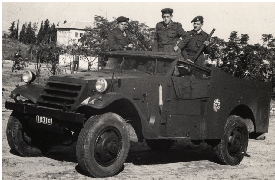
איור 3: שוטרי מג"ב ברכב משוריין (1954), מספר תמונה 0124.412, אלבום הנשיא יצחק בן צבי – סיורים, ארכיון התמונות על שם שושנה ואשר הלוי